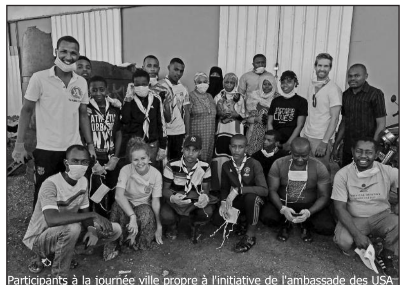
Participants à la journée ville propre à l'initiative de l'ambassade des USA

Ce geste de collaboration témoigne des bonnes relations qui existent entre les Etats-Unis d'Amérique et l'Union des Comores. Dans cette semaine appelée « Américain Week célébration in Comoros », beaucoup d'activités sont envisagées comme des danses traditionnelles, des activités éducatives et culturelles et de propreté.