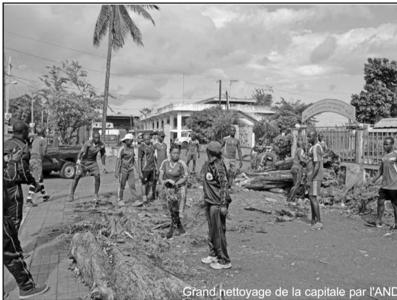
Grand nettoyage de la capitale par l'AND

Le 44e anniversaire de l'indépendance de l'Union des Comores sera célébré ce 6 Juillet. A cet effet, le gouvernement a lancé une série de festivités pour rendre vivante la fête nationale. Et les préparatifs ont commencé depuis hier mercredi par le nettoyage et le badigeonnage du littoral par l'Armée Nationale de Développement (AND). « Avant